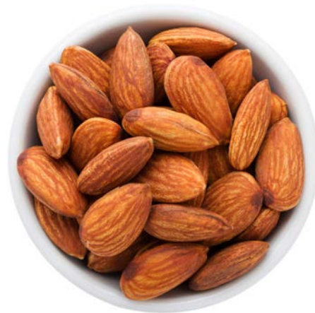
Ein Glas Cola liefert genauso viele Kalorien wie eine Hand voll Mandeln.

Raffinierte Speisen oder Fertigprodukte, die eine Menge Einfachzucker, gepaart mit schlechten Fetten, Geschmacksverstärkern und eventuell chemischen Süßstoffen enthalten, werden vom Körper völlig anders verarbeitet als natürliche Nahrung. In der Natur wächst keine Pizza am Baum: Die Kombination aus Fetten und Kohlenhydraten ist also etwas Unnatürliches. Der Stoffwechsel und vor allem der angeborene Instinkt werden manipuliert – das Sättigungsgefühl wird umgangen.